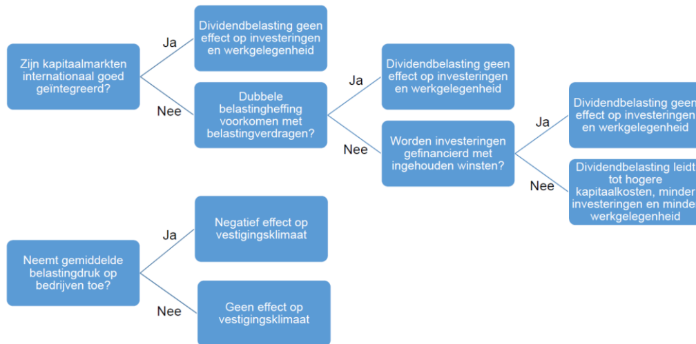
Figuur 2 Wanneer leidt de dividendbelasting tot economische effecten?

Stel nu dat lokale financieringscondities wel van belang zouden zijn voor Nederlandse bedrijven, omdat kapitaalmarkten niet perfect zijn geïntegreerd. De tweede cruciale deelvraag is dan: wordt dubbele belastingheffing op dividend van buitenlandse ondernemingen in Nederland voorkomen? Dat is waarschijnlijk. Voor de Nederlandse aandeelhouder maakt het niets uit, want die kan de dividendbelasting verrekenen. Het omvangrijke Nederlandse netwerk van belastingverdragen poogt dubbele belastingheffing te voorkomen bij buitenlandse aandeelhouders. Als dubbele belastingheffing adequaat wordt voorkomen, dan is de verlaging van de dividendbelasting in Nederland slechts het spekken van buitenlandse aandeelhouders of overheden. Voor bedrijven geldt bovendien vrijwel altijd dat dividenduitkeringen zijn vrijgesteld van belastingheffing via de deelnemingsvrijstelling.